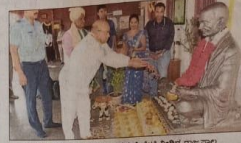
ದಿ ಅಧಿಕಾರಿಗಳಿಂದ ಸಮಾನತೆ ಅಭಿವೃದ್ಧಿ ಕೋಶದ ಸಹಾಯದೊಡನೆ ಕುಟುಂಬ ಕೈ-ವ್ಯವಹಾರ ಮಾಡಲಾಯಿತು.