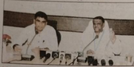
ಕನ್ನಡರ ಕರ್ನಾಟಕ ದಾತೆ