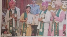
ಅಧಿಕಾರಿಗಳಿಂದ ಸಮಾನತೆ ಅಭಿವೃದ್ಧಿ ಕೋಶದ ಸಹಾಯದೊಡನೆ ಕುಟುಂಬ ಕೈ-ವ್ಯವಹಾರ ಮಾಡಲಾಯಿತು.