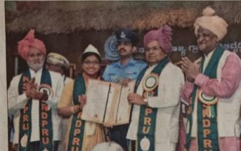
ಗದಗ ಜಗದ ಕೆಎಲ್ ಆರ್ ಡಿಎಲ್ ವಿವಿ 3ನೇ ಘಟಿಕೋತ್ಸವದಲ್ಲಿ, ಬಿಜೋಎನ್ಎಫ್‌ಬಿಎಲ್ ಸಿಬಿ ಲೆ. 92.88 ಅಂಕ ಪಡೆದ ವಿಜ್ಞಾನ ಭಾಷಾಂತ್ರಿಕತೆ ಆಧಾರಿ ರಾಜ್ಯಪಾಲ ಫಾವರ ಚಂದ್ ಗೆಹ್ಲೋಟ ಚಿತ್ರಣ ಪದಕ ನೀಡಿ ಗೌರವಿಸಿದರು.

■ ವಿಳ ಸುದ್ದಿಗಾರ್ ಕೆಎಲ್ ಕೃಷಿ ದೇಶದ ಆರ್ಥಿಕತೆಯ ಬೆನ್ನಲುಬು. ಇಂತಿಹ ಕೃಷಿಯಲ್ಲಿಯೂ ತಾಂತ್ರಿಕತೆ ಹಾಗೂ ಕ್ಷೇಮಿತ ಪದ್ಧತಿಗೆ ಒತ್ತು ನೀಡಬೇಕು ಎಂದು ರಾಜ್ಯಪಾಲ ಫಾವರಚಂದ್ ಗೆಹ್ಲೋಟ ಹೇಳಿದರು. ಗಾಂಧೀಜಿ ಕಂದ ಗ್ರಾಮ ಸ್ವರಾಜ್ ಕನಸು ನನಸಾಗಲಿ ಮಾತೃಭಾಷೆ ಶಿಕ್ಷಣದಿಂದ ದೇಶ ಅಭಿವೃದ್ಧಿಗಿಳಲಿ