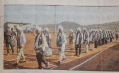
ಗ್ರಾಮೀಣ ಅಭಿವೃದ್ಧಿ ಕೋಶದ ಸಹಾಯದೊಡನೆ ಕುಟುಂಬ ಕೈ-ವ್ಯವಹಾರ ಮಾಡಲಾಯಿತು.