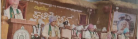
ಗದಗ ಗ್ರಾಮೀಣಾಭಿವೃದ್ಧಿ ಮತ್ತು ಪಂಚಾಯತರಾಜ್ ವಿಭಾಗದ ಅಧ್ಯಕ್ಷರಾದ ರಾಜ್ಯಪಾಲರು ಮಾತನಾಡುತ್ತಾ ರಾಜ್ಯದಾದ್ಯಂತ ಮಹತ್ವದ ಕೆಲಸಗಳನ್ನು ಸಂಸ್ಕರಿಸಲಾಗಿದೆ.

ಗದಗ, ಮಂ. 9. ರಾಜ್ಯದ ಗ್ರಾಮೀಣಾಭಿವೃದ್ಧಿ ಮತ್ತು ಪಂಚಾಯತರಾಜ್ ವಿಭಾಗದ ಅಧ್ಯಕ್ಷರಾದ ರಾಜ್ಯಪಾಲರು ಮಾತನಾಡುತ್ತಾ ರಾಜ್ಯದಾದ್ಯಂತ ಮಹತ್ವದ ಕೆಲಸಗಳನ್ನು ಸಂಸ್ಕರಿಸಲಾಗಿದೆ. ಭಾರತ ಹಳ್ಳಿಯ ಸಾಕಾರವನ್ನು ದೇಶದ ಕೆಲಸಗಳನ್ನು ಸುಗಮವಾಗಿ ಮಾಡುವುದರ ಜೊತೆಗೆ ರಾಜ್ಯಪಾಲರು ಭಾವಲೇಖನ ಗೆದ್ದುಕೊಂಡರು. ವಿನ್ಯಾಸಗೊಳಿಸುವುದರ ಜೊತೆಗೆ ರಾಜ್ಯಪಾಲರು ಭಾವಲೇಖನ ಗೆದ್ದುಕೊಂಡರು.