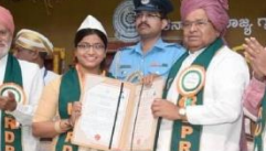
ಗ್ರಾಮೀಣಾಭಿವೃದ್ಧಿ ಮತ್ತು ಪಂಚಾಯತ್ ರಾಜ್ ವಿಶ್ವವಿದ್ಯಾಲಯದ ಮೂರನೇ ಘಟಕೋತ್ಸವದ ಸಂದರ್ಭದಲ್ಲಿ ದಿ. 11, 2023 ರಂದು ಕುಟುಂಬ ಕೈ-ವ್ಯವಹಾರ ಮಾಡಲಾಯಿತು.

ಕೃಷಿ ದೇಶದ ಅಭಿವೃದ್ಧಿಯ ಬೆನ್ನಲಾಗಿರುವುದರಿಂದ ಕೃಷಿ ಕ್ಷೇತ್ರದಲ್ಲಿ ಬದಲಾವಣೆಯಾಗಬೇಕಾಗಿದೆ. ಕೃಷಿ ರಂಗದಲ್ಲಿಯೇ ತಾಂತ್ರಿಕತೆಯನ್ನು ಅಳವಡಿಸಿಕೊಳ್ಳುವುದರ ಜೊತೆಗೆ ಜೈವಿಕ ಕೃಷಿ ಪದ್ಧತಿಗೆ ಒತ್ತು ನೀಡಬೇಕು ಎಂದು ರಾಜ್ಯಪಾಲ ಗೆಹ್ಲೋಟ್ ಹೇಳಿದರು.