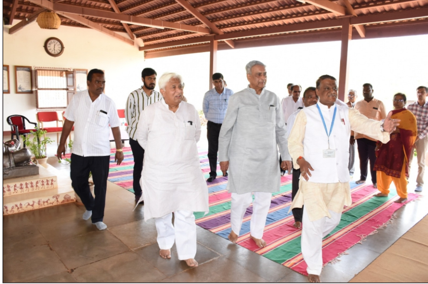
ಮಾನ್ಯಶ್ರೀ ಬಸವರಾಜ ಹೊರಟ್ಟಿ ವಿಧಾನ ಪರಿಷತ್ ಸಭಾಪತಿಗಳು ಹಾಗೂ ಮಾನ್ಯ ಶ್ರೀ ಎಚ್. ಕೆ. ಪಾಟೀಲ ಗದಗ ಜಿಲ್ಲೆ ಉಸ್ತುವಾರಿ ಸಚಿವರು ಸಬರಮತಿ ಆಶ್ರಮಕ್ಕೆ ಭೇಟಿ ನೀಡಿರುವ ಸಂದರ್ಭ.