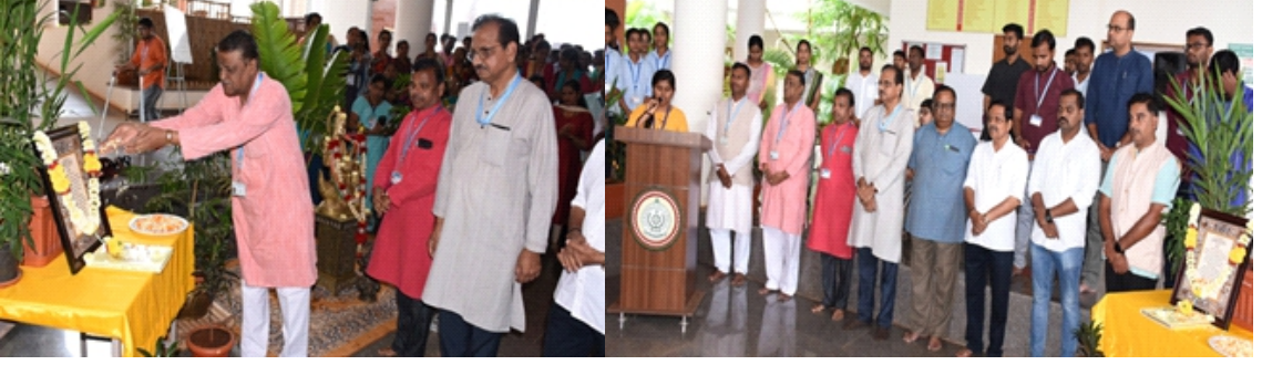
ವಿಶ್ವವಿದ್ಯಾಲಯದಲ್ಲಿ ಅಂತರಾಷ್ಟ್ರೀಯ ಪ್ರಜಾಪ್ರಭುತ್ವ ದಿನಾಚರಣೆಯ ಆಚರಣೆ

ಸಮಾನ ಭಾಗವಹಿಸುವಿಕೆಯೊಂದಿಗೆ ಕಾರ್ಯನಿರ್ವಹಿಸುವ ಸರ್ಕಾರದ ಒಂದು ರೂಪವಾಗಿದೆ. ನಾಗರಿಕರ ಹಕ್ಕುಗಳ ಸಂರಕ್ಷಣೆ ಮತ್ತು ಆಚರಣೆಗೆ ಸಂವಿಧಾನವು ಹೆಚ್ಚಿನ ಪ್ರಾಮುಖ್ಯತೆಯನ್ನು ಹೊಂದಿರುತ್ತದೆ. ಈ ಹಿನ್ನೆಲೆಯಲ್ಲಿ ಕರ್ನಾಟಕ ಸರ್ಕಾರವು ನಮ್ಮ ದೇಶದ ಸಂವಿಧಾನ ಪೂರ್ವ ಪೀಠಿಕೆಯನ್ನು ಪಠನ ಮಾಡುವ ಮೂಲಕ ಈ ದಿನವನ್ನು ಆಚರಿಸಲು ಕರೆ ನೀಡಲಾಗಿತ್ತು.