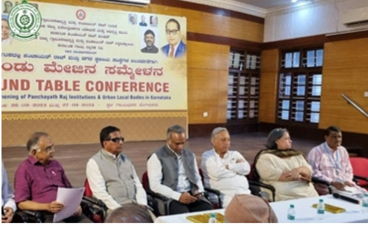
ಕರ್ನಾಟಕದಲ್ಲಿ ಪಂಚಾಯತ್ ರಾಜ್ ಮತ್ತು ನಗರ ಸ್ಥಳೀಯ ಸಂಸ್ಥೆಗಳ ಬಲವರ್ಧನೆಗಾಗಿ ಬೆಂಗಳೂರಿನ ಗಾಂಧಿಭವನದಲ್ಲಿ ದುಂಡು ಮೇಜಿನ ಸಮ್ಮೇಳನ

ಗ್ರಾಮೀಣಾಭಿವೃದ್ಧಿ ಮತ್ತು ಪಂಚಾಯತ್ ರಾಜ್ ಇಲಾಖೆ, ಕರ್ನಾಟಕ ರಾಜ್ಯ ವಿಕೇಂದ್ರೀಕರಣ ಯೋಜನೆ ಮತ್ತು ಅಭಿವೃದ್ಧಿ ಸಮಿತಿ, ಕರ್ನಾಟಕ ಪಂಚಾಯತ್ ರಾಜ್ ಪರಿಷತ್, ಕರ್ನಾಟಕ ರಾಜ್ಯ ಗ್ರಾಮೀಣಾಭಿವೃದ್ಧಿ ಮತ್ತು ಪಂಚಾಯತ್ ರಾಜ್ ವಿಶ್ವವಿದ್ಯಾಲಯ, ಗದಗ ಹಾಗೂ ಕರ್ನಾಟಕ ಗಾಂಧಿ ಸ್ಮಾರಕ ನಿಧಿ ಇವರ ಸಹಯೋಗದೊಂದಿಗೆ ಕರ್ನಾಟಕದಲ್ಲಿ ಪಂಚಾಯತ್ ರಾಜ್ ಮತ್ತು ನಗರ ಸ್ಥಳೀಯ ಸಂಸ್ಥೆಗಳ ಬಲವರ್ಧನೆಗಾಗಿ ದಿನಾಂಕ 26.09.2023 ಹಾಗೂ 27.09.2023 ರಂದು ಬೆಂಗಳೂರಿನ ಗಾಂಧಿ ಭವನದಲ್ಲಿ ದುಂಡು ಮೇಜಿನ ಸಮ್ಮೇಳನವನ್ನು ನಡೆಸಲಾಯಿತು.