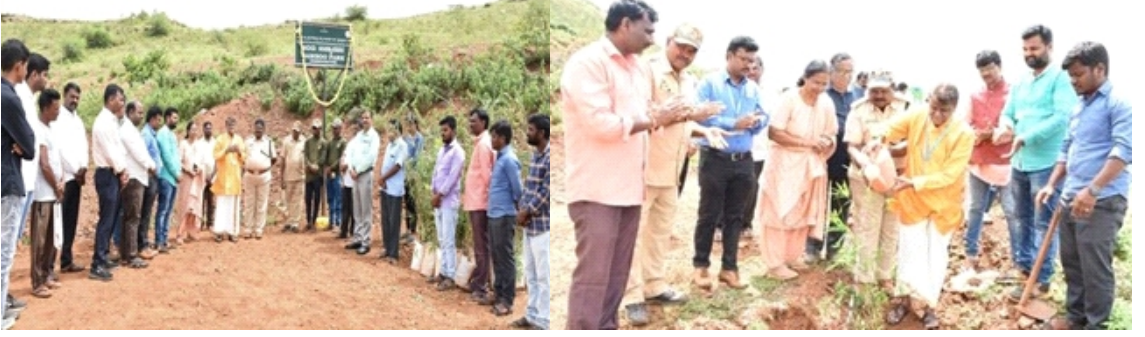
ವಿಶ್ವವಿದ್ಯಾಲಯದಲ್ಲಿ ವಿಶ್ವ ಬಿದಿರು ದಿನಾಚರಣೆಯ ಆಚರಣೆ

ಕರ್ನಾಟಕ ರಾಜ್ಯ ಗ್ರಾಮೀಣಾಭಿವೃದ್ಧಿ ಮತ್ತು ಪಂಚಾಯತ್ ರಾಜ್ ವಿಶ್ವವಿದ್ಯಾಲಯವು ಉಪ ಅರಣ್ಯ ಸಂರಕ್ಷಣಾಧಿಕಾರಿಗಳ ಸಹಯೋಗದೊಂದಿಗೆ ವಿಶ್ವವಿದ್ಯಾಲಯದಲ್ಲಿ ವಿಶ್ವ ಬಿದಿರು ದಿನಾಚರಣೆಯ ಕಾರ್ಯಕ್ರಮವನ್ನು ಹಮ್ಮಿಕೊಂಡಿದ್ದು, ವಿಶ್ವವಿದ್ಯಾಲಯದ ಆವರಣದಲ್ಲಿ ಬಿದಿರು ಗಿಡಗಳನ್ನು ನೆಡಲಾಯಿತು. ಈ ಕಾರ್ಯಕ್ರಮವು ಸುಸ್ಥಿರತೆ, ಪರಿಸರ ಜಾಗೃತಿಗೆ ಕೊಡುಗೆ ಮತ್ತು ಆವರಣದಲ್ಲಿ ಯೋಗಕ್ಷೇಮಕ್ಕೆ ಬದ್ಧತೆಯನ್ನು ಸಂಕೇತಿಸುತ್ತದೆ.