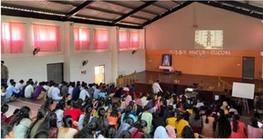
ವಿಶ್ವವಿದ್ಯಾಲಯದಲ್ಲಿ ಭಾರತದ ಜೊಜ್ಜಲ ಸೌರ ಮಿಷನ್, ಆದಿತ್ಯ-ಎಲ್ 1ರ ಲೈವ್ ಟೆಲಿಕಾಸ್ಟಿಂಗ್‌ನ ವೀಕ್ಷಣೆ