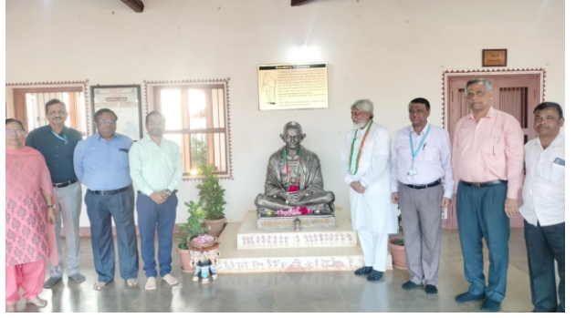
ಪ್ರತಿಷ್ಠಿತ ರಾಮನ್ ಮ್ಯಾಂಗ್‌ಸೆ ಪ್ರಶಸ್ತಿ ಪುರಸ್ಕೃತರಾದ ಮತ್ತು ಭಾರತದ ವಾಟರ್‌ಮ್ಯಾನ್ ಡಾ. ರಾಜೇಂದ್ರ ಸಿಂಗ್‌ರವರು ವಿಶ್ವವಿದ್ಯಾಲಯಕ್ಕೆ ಭೇಟಿ

ಕರ್ನಾಟಕ ರಾಜ್ಯ ಗ್ರಾಮೀಣಾಭಿವೃದ್ಧಿ ಮತ್ತು ಪಂಚಾಯತ್ ರಾಜ್ ವಿಶ್ವವಿದ್ಯಾಲಯಕ್ಕೆ ಪ್ರತಿಷ್ಠಿತ ರಾಮನ್ ಮ್ಯಾಂಗ್‌ಸೆ ಪ್ರಶಸ್ತಿ ಪುರಸ್ಕೃತರಾದ ಮತ್ತು ಭಾರತದ ವಾಟರ್‌ಮ್ಯಾನ್ ಎಂದು ಕರೆಯಲ್ಪಡುವ ರಾಜಸ್ಥಾನದ ಡಾ. ರಾಜೇಂದ್ರ ಸಿಂಗ್ ಅವರು ದಿನಾಂಕ 21-12-2023 ರಂದು ಭೇಟಿ ನೀಡಿದರು. ವಿಶ್ವವಿದ್ಯಾಲಯದ ವಿದ್ಯಾರ್ಥಿಗಳಿಗೆ ಅವರು ವಿಶ್ವವಿದ್ಯಾಲಯದ ಆವರಣದಲ್ಲಿ ನೀರಿನ ಸಂರಕ್ಷಣೆ ಮತ್ತು ಪುನರುಜ್ಜೀವನಕ್ಕಾಗಿ ಉಪಯುಕ್ತ ಮಾರ್ಗದರ್ಶನ ನೀಡಿದರು.