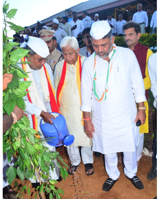
ಮುಖ್ಯ ಮಂತ್ರಿಗಳಾದ ಸನ್ಮಾನ್ಯ ಶ್ರೀ ಸಿದ್ದರಾಮಯ್ಯ ಅವರು ಮತ್ತು ಉಪ ಮುಖ್ಯಮಂತ್ರಿಗಳಾದ ಸನ್ಮಾನ್ಯ ಶ್ರೀ ಡಿ.ಕೆ. ಶಿವಕುಮಾರ ಹಾಗೂ ಸನ್ಮಾನ್ಯ ಶ್ರೀ ಡಾ. ಎಚ್. ಕೆ. ಪಾಟೀಲರು ಸಬರಮತಿ ಆಶ್ರಮಕ್ಕೆ ಭೇಡಿ ನೀಡಿದ ಸ್ಮರಣಾರ್ಥವಾಗಿ ಆಶ್ರಮದ ಆವರಣದಲ್ಲಿ ಸಸಿ ನೆಡುತ್ತಿರುವುದು ಹಾಗೂ ಇತರ ಪ್ರಮುಖ ಗಣ್ಯರು ಉಪಸ್ಥಿತರಿರುವುದು.

ಮಾನ್ಯ ಮುಖ್ಯಮಂತ್ರಿಗಳು ವಿಶ್ವವಿದ್ಯಾಲಯ ಮತ್ತು ವಿಶ್ವವಿದ್ಯಾಲಯದ ಸಬರಮತಿ ಆಶ್ರಮವು ರಮಣೀಯ ಪರಿಸರದಲ್ಲಿ ನಿರ್ಮಾಣಗೊಂಡಿರುವುದನ್ನು ನೋಡಿ ಸಂತಸ ಪಟ್ಟರು. “ನೈಜವಾದ ಗ್ರಾಮೀಣಚಿತ್ರಣ ಇಲ್ಲಿ ಮೂಡಿ ಬಂದಿದೆ. ಮುಂದಿನ ಕಾರ್ಯಸಾಧನೆ ಮತ್ತು ಯಶಸ್ಸಿಗೆ ಶುಭಕೋರುತ್ತೇನೆ” ಎಂದು ಮಾನ್ಯ ಉಪ ಮುಖ್ಯಮಂತ್ರಿಗಳು ಆಶ್ರಮದ ಸಂದರ್ಶಕರ ಪುಸ್ತಕದಲ್ಲಿ ದಾಖಲಿಸಿದ್ದಾರೆ.