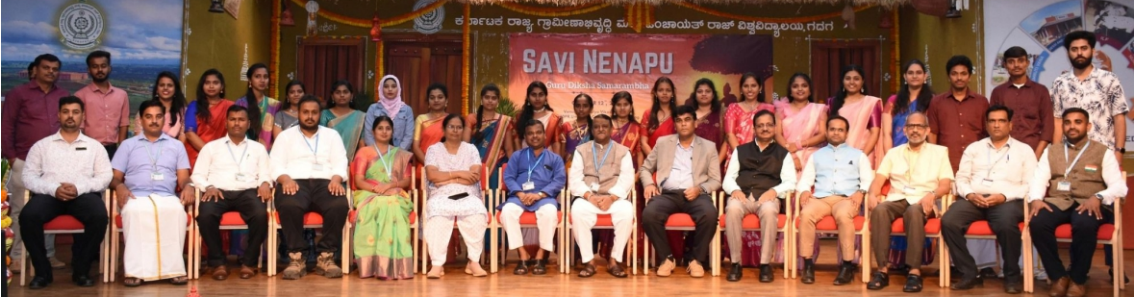
2022-23ನೇ ಸಾಲಿನ ಸ್ನಾತಕೋತ್ತರ ಪದವಿ ಕಾರ್ಯಕ್ರಮಗಳ ಅಂತಿಮ ವರ್ಷದ ವಿದ್ಯಾರ್ಥಿಗಳು “ಗುರುದೀಕ್ಷಾ” (ಸವಿನೆನಪು) ಕಾರ್ಯಕ್ರಮದಲ್ಲಿ ಭಾಗವಹಿಸಿರುವುದು