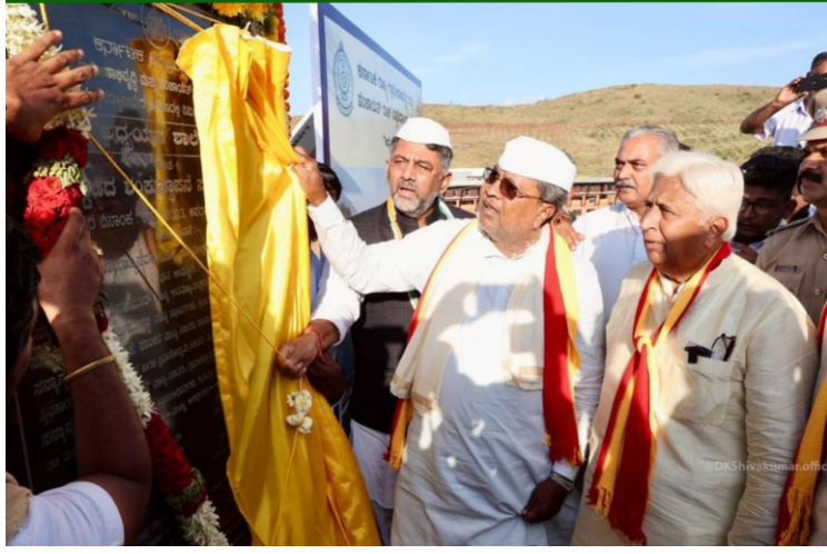
ಮಾನ್ಯ ಮುಖ್ಯಮಂತ್ರಿಗಳಿಂದ ವಿಶ್ವವಿದ್ಯಾಲಯದಲ್ಲಿ ನಿರ್ಮಾಣವಾಗುವ ಅಧ್ಯಯನ ಶಾಲೆ-2ರ ಶಂಕುಸ್ಥಾಪನೆ