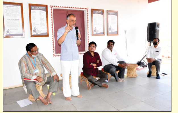
ಬಸವಾ ಗ್ರೂಪ್ ಆಫ್ ಕಂಪನಿಯ