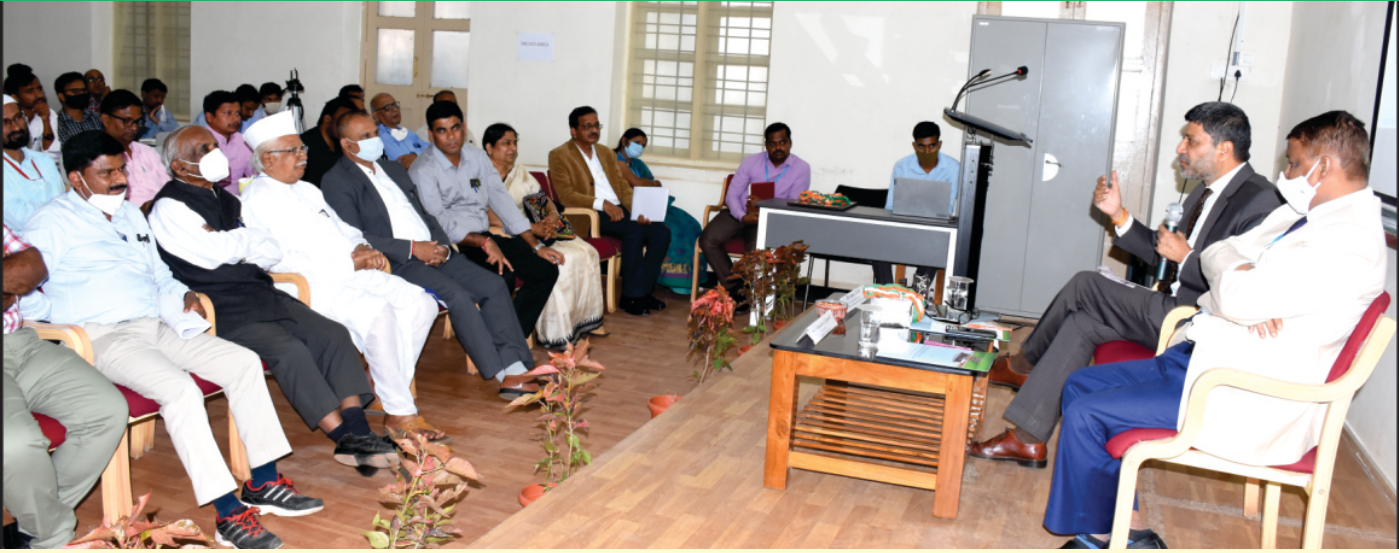
ರೈತರ ಆದಾಯವನ್ನು ದ್ವಿಗುಣಗೊಳಿಸುವುದರ ಕುರಿತು ಸಂವಾಧಾತ್ಮಕ ಅಧಿವೇಶನ