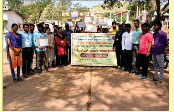
ಸ್ವಚ್ಛತೆಯ ಕುರಿತು ನಾಗಾವಿ ಗ್ರಾಮದಲ್ಲಿ ಜಾಗೃತಿ ಜಾಥಾವನ್ನು ನಡೆಸುತ್ತಿರುವುದು