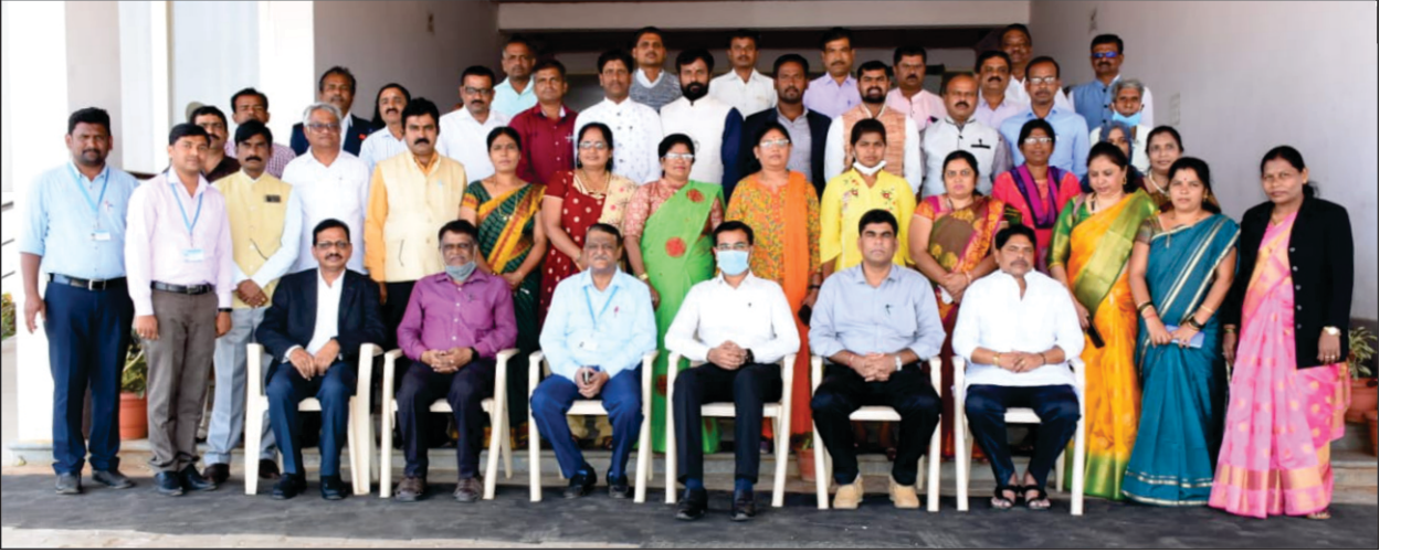
ವಿಶ್ವವಿದ್ಯಾಲಯದಲ್ಲಿ ನಡೆದ “ಪಂಚಾಯತ್ ರಾಜ್ ವ್ಯವಸ್ಥೆಯ ಬಲವರ್ಧನೆಯಲ್ಲಿ ಸ್ವಯಂ ಸೇವಾ ಸಂಸ್ಥೆಗಳ ಪಾತ್ರ ಮತ್ತು ಜವಾಬ್ದಾರಿ” ವಿಷಯದ ಬಗ್ಗೆ ಎರಡು ದಿನಗಳ ಕಾರ್ಯಾಗಾರದಲ್ಲಿ ಸ್ವಯಂ ಸೇವಾ ಸಂಸ್ಥೆಗಳ ಪ್ರತಿನಿಧಿಗಳು ಭಾಗವಹಿಸಿದ್ದು