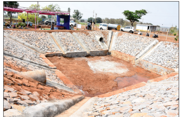
ವಿಶ್ವವಿದ್ಯಾಲಯದ ನೂತನ ಆವರಣದಲ್ಲಿ ಸ್ಥಾಪಿತವಾದ ಮಾದರಿ ಕೃಷಿ ಹೊಂಡ

ವಿಶ್ವವಿದ್ಯಾಲಯವು ವಿದ್ಯಾರ್ಥಿಗಳಿಗೆ ಮುಂದಿನ ಭವಿಷ್ಯದಲ್ಲಿ ಕೇವಲ ಪುಸ್ತಕೀಯ ಜ್ಞಾನ ಮಾತ್ರವಲ್ಲದೆ ಎಲ್ಲಾ ರೀತಿಯ ನೈಜ ಜೀವನದಲ್ಲಿ ಬದುಕಲು ಬೇಕಾದ ಅವಶ್ಯಕತೆಗಳನ್ನು ಮತ್ತು ಕೃಷಿಯ ಬಗ್ಗೆ ಪ್ರಾಯೋಗಿಕವಾಗಿ ತರಬೇತಿ ಪಡೆಯಲು ಉತ್ತಮವಾದ ಸುವರ್ಣಾವಕಾಶವನ್ನು ಕಲ್ಪಿಸಿದೆ. ವಿದ್ಯಾರ್ಥಿಗಳ ಉಜ್ವಲ ಭವಿಷ್ಯವನ್ನು ರೂಪಿಸುತ್ತಿರುವ ವಿಶ್ವವಿದ್ಯಾಲಯ ಮತ್ತು ವಿಶ್ವವಿದ್ಯಾಲಯದ ಕುಲಪತಿಗಳಿಗೆ ಸದಾ ಚಿರಋಣಿಯಾಗಿರುತ್ತೇನೆ.