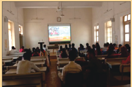
ಕೇಂದ್ರ ಬಜೆಟ್ 2021-22 ನೇರ ಪ್ರಸಾರದ ಭಾವಚಿತ್ರಗಳು