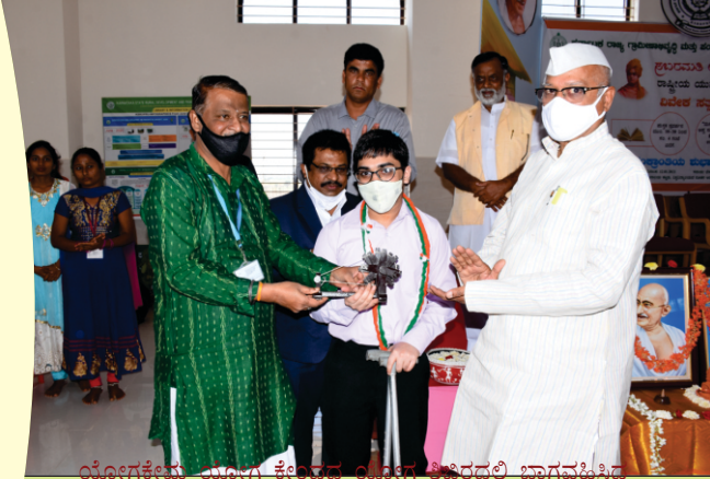
ಯೋಗಕ್ಷೇಮ ಯೋಗ ಕೇಂದ್ರದ ಯೋಗ ತೀರ್ಥದಲ್ಲಿ ಭಾಗವಹಿಸಿದ ವಿದ್ಯಾರ್ಥಿಗಳಿಗೆ ಪ್ರಮಾಣಪತ್ರಗಳನ್ನು ವಿತರಿಸಲಾಯಿತು.