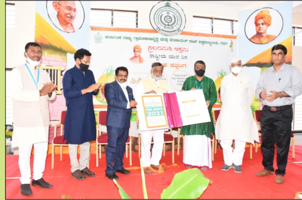
ಅತಿಥಿಗಳು ಪುಸ್ತಕ ಪ್ರದರ್ಶನಕ್ಕೆ ಚಾಲನೆ ನೀಡುತ್ತಿರುವುದು.