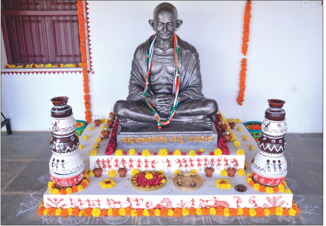
ವಿಶ್ವವಿದ್ಯಾಲಯದಲ್ಲಿ ಮಹಾತ್ಮ ಗಾಂಧೀಜಿಯವರ ಪ್ರೇರಣಾ ಕೇಂದ್ರ