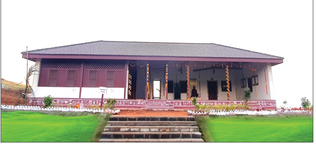
ಸಬರಮತಿ ಆಶ್ರಮದ ಪ್ರತಿಬಿಂಬ ವಿಶ್ವವಿದ್ಯಾಲಯದ ಆವರಣದಲ್ಲಿ