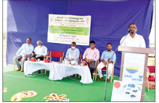
ಗಣ್ಯರು ಕಾರ್ಯಕ್ರಮದ ಉದ್ಘಾಟನೆಯನ್ನು ನೆರವೇರಿಸುತ್ತಿರುವುದು.