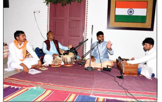
ವಿಶ್ವವಿದ್ಯಾಲಯದ ಸಬರಮತಿ ಆಶ್ರಮದಲ್ಲಿ ಮಹಾಶಿವರಾತ್ರಿಯ ಅಂಗವಾಗಿ ಶಿವಪೂಜೆ ಮತ್ತು ಶಿವನಾಮ ಸ್ಮರಣೆಯೊಂದಿಗೆ ಶಿವ ಸತ್ಸಂಗಕ್ಕೆ ಚಾಲನೆಯನ್ನು ನೀಡುತ್ತಿರುವುದು